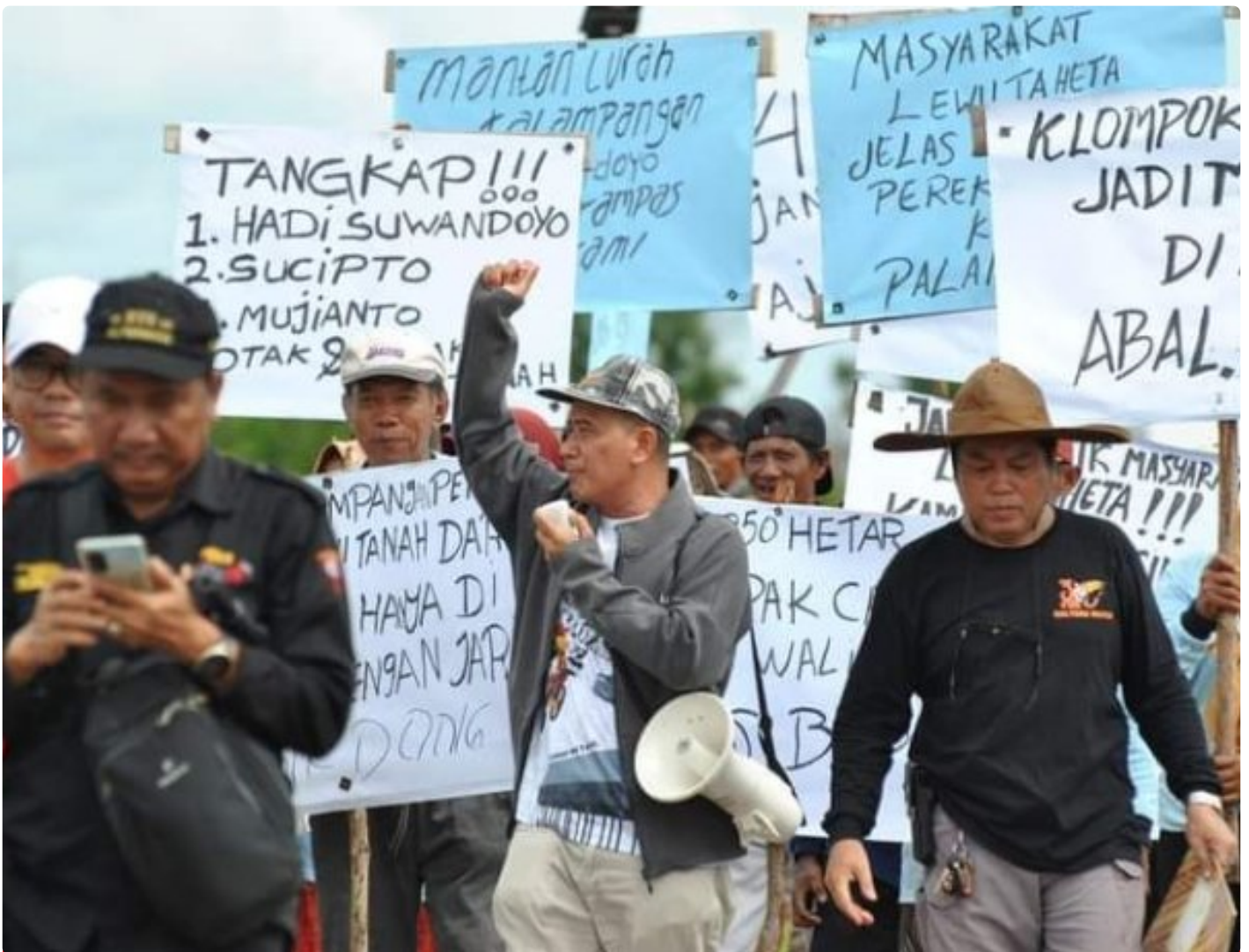
Gambar: Aksi Unjuk Rasa Masyarakat Kelompok Tani

PALANGKA RAYA - Sengketa kepemilikan tanah yang terjadi di Kota Palangka Raya selama ini, cukup meresahkan. Hal ini tentunya bisa mempengaruhi geliat pembangunan di ibukota provinsi Kalimantan Tengah (Kalteng) kedepannya.